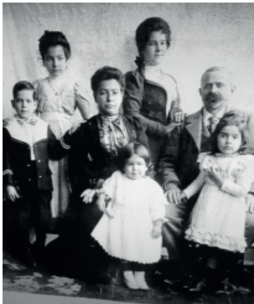
Mis abuelos junto a las «cinco raíces cubanas», año 1898

Tras el fin de la contienda, «abuelito» —como yo le llamaba de niño— decidió que había llegado el momento de regresar a España y, junto a toda su familia, se subió al barco Alfonso XIII poniendo rumbo hacia Santander. El éxito, medido en términos de dinero, le había acompañado durante su experiencia cubana y, al igual que muchos otros indios, regresó a España como hombre rico. El retorno no se completó del todo, ya que no se estableció en Abandames, sino que lo hizo en Gijón, donde adquirió una finca de recreo situada a las afueras de la ciudad, en Mareo. Durante más de tres décadas esa finca, que fue bautizada como Villa Almendares (tomando el nombre del río de La Habana), se convirtió en el lugar de veraneo de toda la familia y el sitio al que están ligados muchos bellos recuerdos.