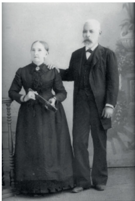
El origen de mi origen: mis bisabuelos (durante la boda de mis abuelos)